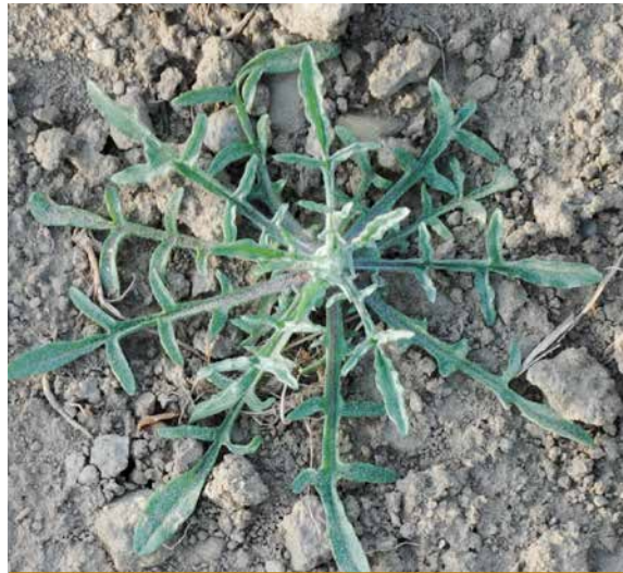
Abb. 5b: Beispiel einer Rosette: Kornblume