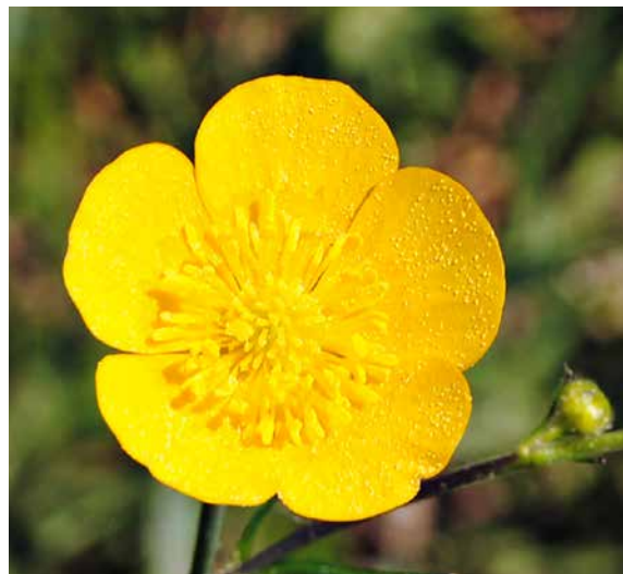
Abb. 4: Scharfer Hahnenfuß, Ranunculus acris , Blüte