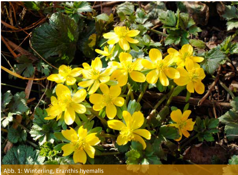
Abb. 1: Winterling, Eranthis hyemalis