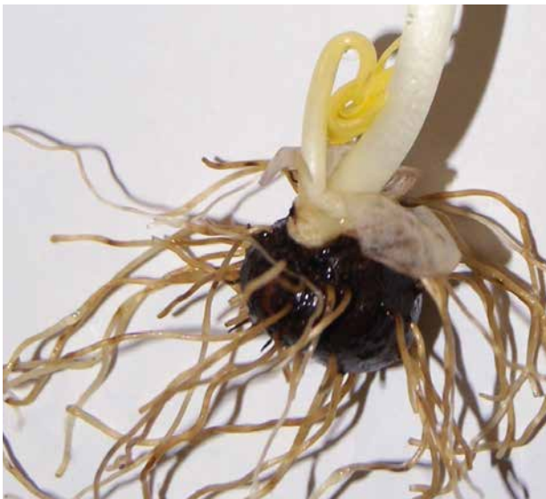
Abb. 7: Winterling, Sprossknolle – der unterirdische, stark gestauchte, vegetative Spross der Pflanze. Sichtbar ist neben dem Blütrieb ein zusätzliches Blatt. Die Wurzeln erinnern an ein Zwiebelgewächs.