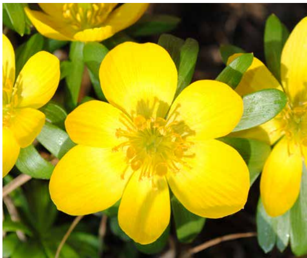
Abb. 3: Winterling, Blüte

Die kosmische Seite lässt sich erleben, wenn wir uns die Blattformen einer Pflanze genauer anschauen. Am Anfang, in den ersten rundlichen Blättern dieser Blattmetamorphose überwiegt noch das irdisch-vegetative Wachstum. Dann sieht man, wie sich die Blätter immer mehr durchgestalten