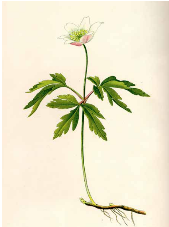
Abb. 10: Auch beim Buschwindröschen stehen die Hochblätter auf einer Ebene. Entnommen aus Wikipedia, überarbeitet.

Wenn wir Umschau halten bei den Hahnenfußgewächsen finden wir noch einen anderen Frühjahrsblüher mit – in der Regel 9 – 6 Blütenblättern: Auch das Buschwindröschen ( Anemone nemorosa , ▶