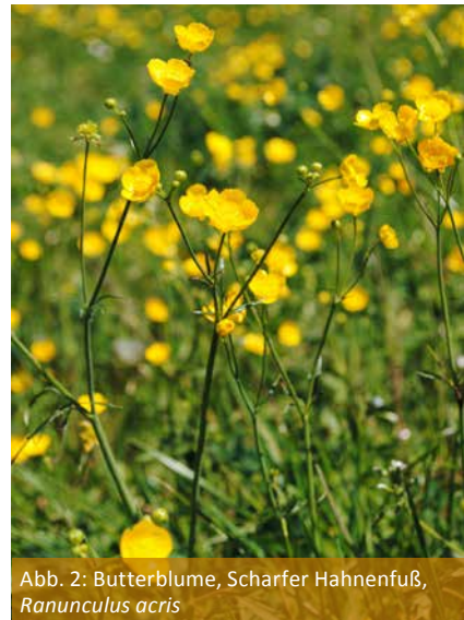
Abb. 2: Butterblume, Scharfer Hahnenfuß, Ranunculus acris