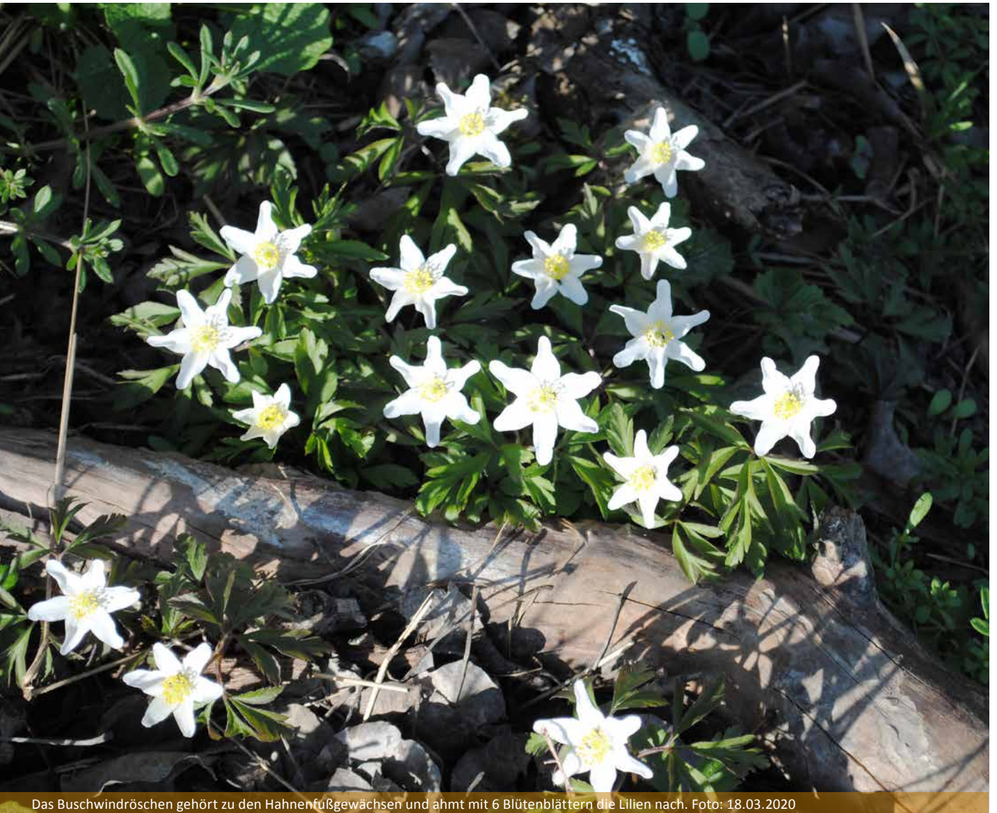
Das Buschwindröschen gehört zu den Hahnenfußgewächsen und ahmt mit 6 Blütenblättern die Lilien nach. Foto: 18.03.2020