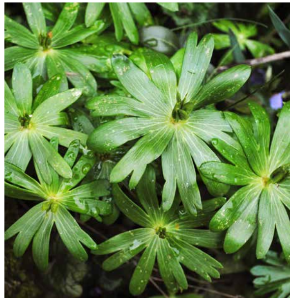
Abb. 8: Winterling nach der Blüte mit noch grünen Fruchtkapseln und der Ebene der Hochblätter, die noch an Größe zugenommen haben.