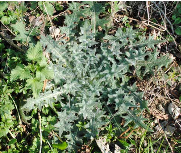
Abb. 5a: Beispiel einer Rosette: Eselstistel

„Die Pflanze hat ja, so wie sie zunächst auf dem Boden steht, nur ihren physischen Leib und ihren Ätherleib, nicht den astralischen Leib in sich darinnen wie das Tier; aber das Astralische von außen muss sie überall umgeben. Die Pflanze würde nicht blühen, wenn das Astralische sie nicht von außen berührte. Sie nimmt nur nicht das Astralische auf wie das Tier und der Mensch, aber sie muss von außen davon berührt werden.“