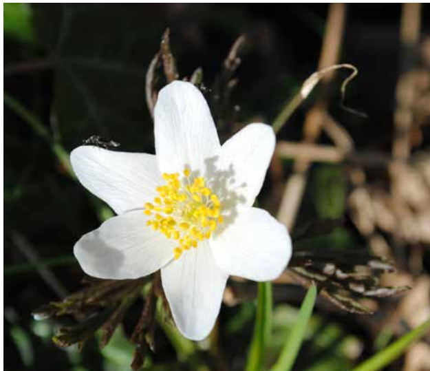
Abb. 9: Buschwindröschen ( Anemone nemorosa ), in der Regel mit 6 Blütenblättern, hier deutlich 3 äußere und 3 innere, unterschiedlich geformt. Zu erkennen sind auch (noch nicht entfaltet) die drei Hochblätter, im gleichen Winkel angeordnet wie die oberen 3 Blütenblätter.

Beim Klatschmohn ( Papaver rhoeas ) in der Skizze (Abb. 6) wird die Blütenanlage im Zentrum der vegetativen Rosette gebildet, dann schiebt sich der Blütentrieb in die Höhe. In diesem Fall liegt also die Grenze dicht über der normalen Erdoberfläche.