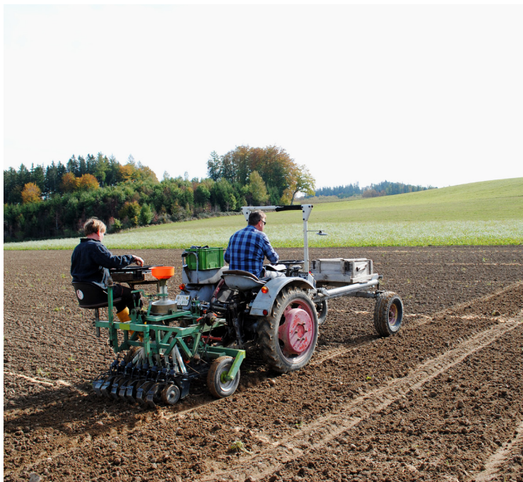
Die Arbeit muss weitergehen für qualitativ gute Weizensorten!

Dieses Protein hat eine sehr stabile, kompakte Struktur, die beim Kochen und Backen nicht zerstört wird. Deshalb wird es auch nur unvollständig verdaut, zumal es selber das Trypsin und damit die eigene Verdauung hemmt. Wenn dieses unverdaute ATI in die Poren der Darmschleimhaut eindringt, wird es von den allgegenwärtigen Zellen des angeborenen Immunsystems erkannt und beseitigt. Erst im Überschuss kommt es zu einer Entzündung mit Verdauungsproblemen. Diese Grenze wird bei Dinkel und Emmer nur selten erreicht, daher die bessere Verträglichkeit.