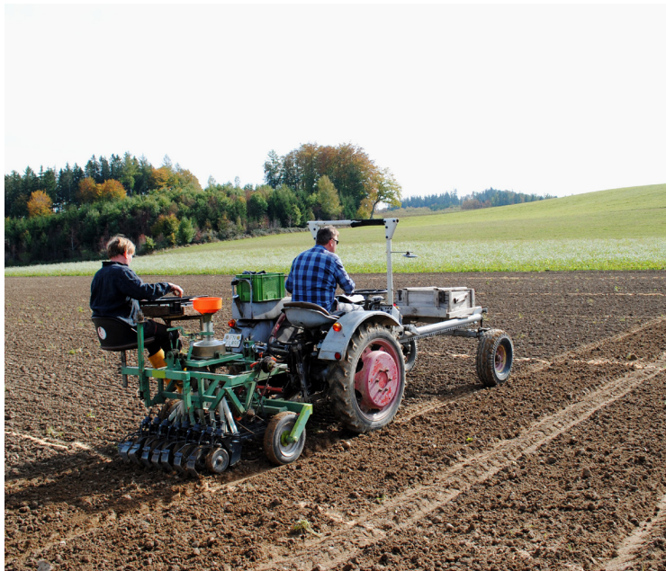
Die Arbeit muss weitergehen für qualitativ gute Weizensorten!

Dieses Protein hat eine sehr stabile, kompakte Struktur, die beim Kochen und Backen nicht zerstört wird. Deshalb wird es auch nur unvollständig verdaut, zumal es selber das Trypsin und damit die eigene Verdauung hemmt. Wenn dieses unverdaute ATI in die Poren der Darmschleimhaut eindringt, wird es von den allgegenwärtigen Zellen des angeborenen Immunsystems erkannt und beseitigt. Erst im Überschuss kommt es zu einer Entzündung mit Verdauungsproblemen. Diese Grenze wird bei Dinkel und Emmer nur selten erreicht, daher die bessere Verträglichkeit.